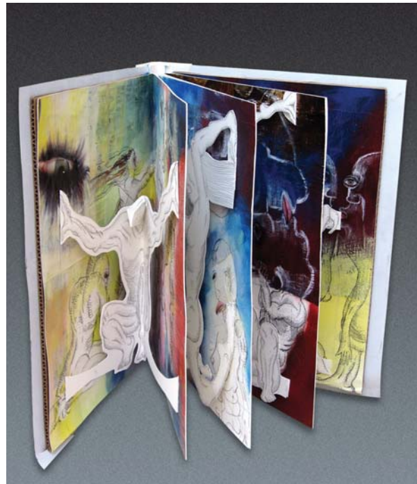
Bitácora de familia. Libro objeto colapsable

La información que se plantea como elemento justificador del proyecto creativo me permitirá entrar en una serie de fases que irán desde la recopilación visual hasta procesos de pre-experimentación, combinando elementos formales relacionados con el grabado, el dibujo y la pintura e incorporando alternativas y experiencias adicionales