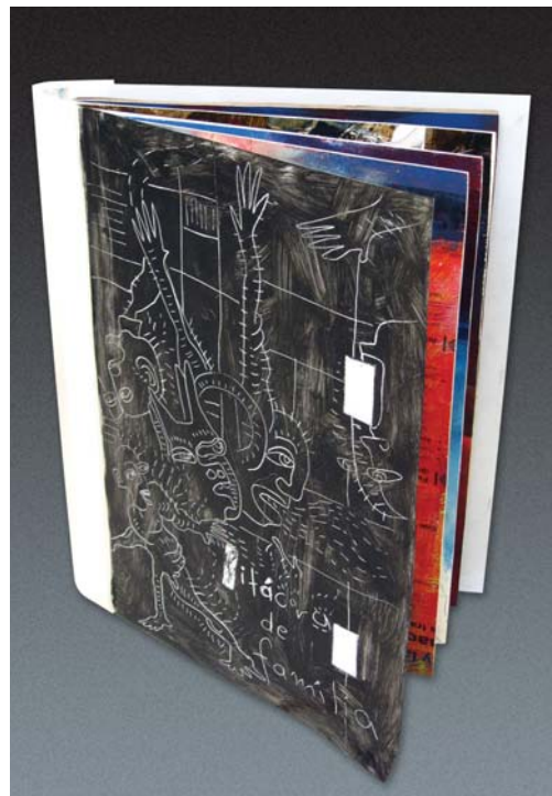
Bitácora de familia. Libro objeto colapsable

En este ejercicio plástico, pretendo desarrollar cuatro temas para la producción de los libros objeto, el primero de ellos lo llamo Evolución-Involución , donde por medio de una bitácora diaria de imágenes "retrataré" el paisaje urbano; es decir, elaboraré un diario con dibujos y fotos del cambio del paisaje urbano en la Ciudad de México sobre obras en construcción y los efectos que ello genera, como los cambios en la circulación, los cambios en la arquitectura y el paisaje. Es la ciudad en perpetuo cambio.