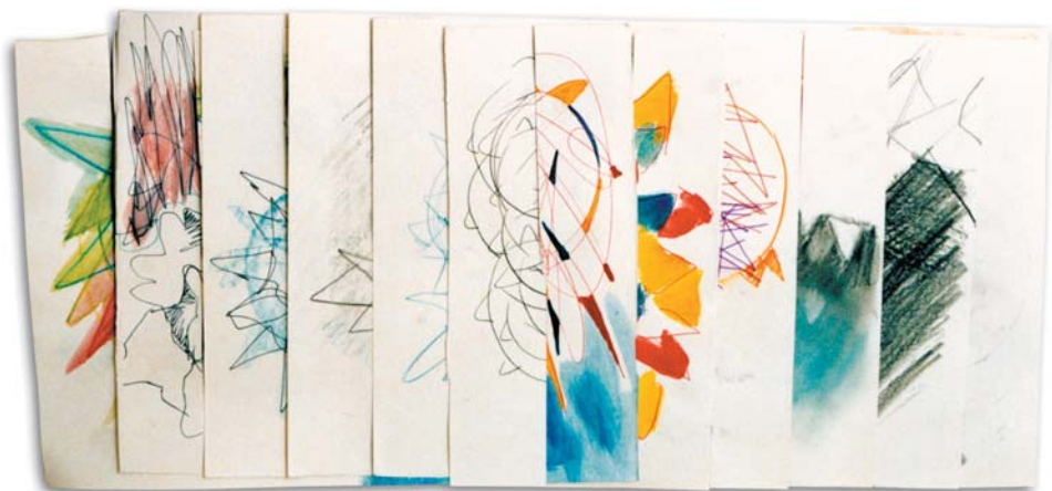
Distintas caras de un objeto. Libro Objeto colapsable Grafito y pastel sobre papel.

Por el otro lado, el de la experiencia artística, he sido testigo presencial de la disolución de las fronteras tradicionales del arte, que ha replanteado la forma y el lugar en las que éste accede a su público. Y ha sido, precisamente, el libro objeto el que me ha permitido establecer esta sinergia entre un proceso comunicativo y el de una expresión plástica; pues contiene elementos narrativos en combinación con prácticas del arte tradicional, desde el cual pueden plantearse alternativas reales a la creación, distribución y consumo del arte.