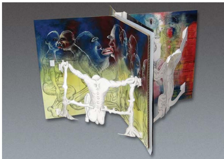
Bitácora de familia. Libro objeto colapsable