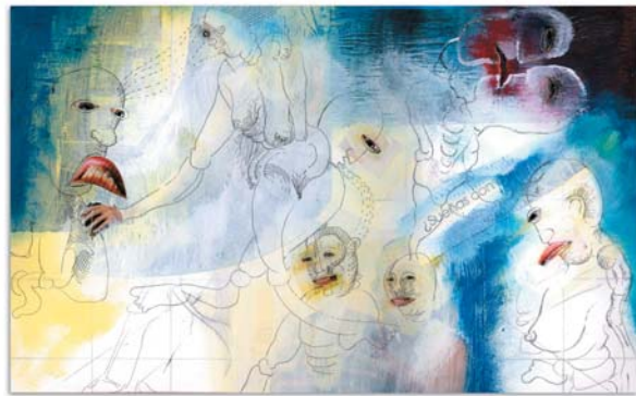
La distancia y la duda. Páginas para libro objeto Grafito, collage y acrílico sobre papel.