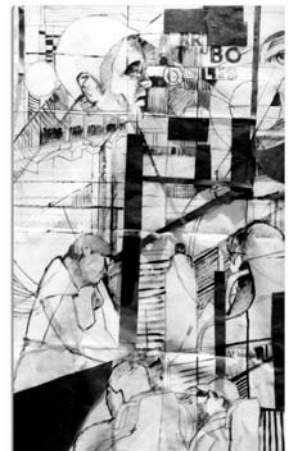
Espacios de anonimato Dibujos en campos expandidos. Acrílico y recortes de papel sobre tela.