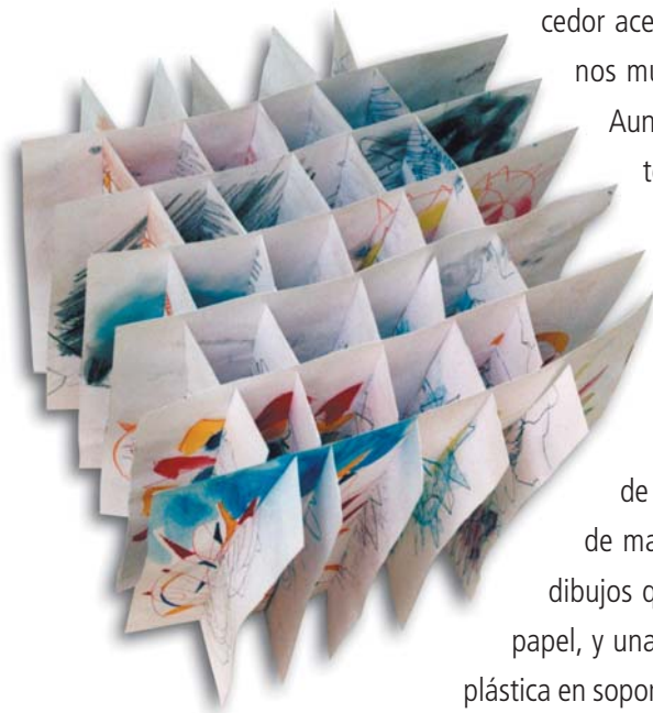
Distintas caras de un objeto. Libro Objeto colapsable Grafito y pastel sobre papel.

En este proyecto, relacionado e inspirado con producción de dibujo en grandes formatos y con un concepto de dibujo que se denomina dibujos en campos expandidos que, de manera general se refiere, precisamente, a la elaboración de dibujos que trascienden más allá del espacio físico y tradicional del papel, y una inquietud creciente por el desarrollo y la experimentación plástica en soportes, materiales y herramientas de reciclaje, instalación, audio y video en combinación con técnicas más tradicionales como la pintura y el grabado, he pretendido hacer una reflexión visual acerca de la condición humana contem-