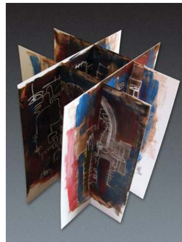
Mundos dislocados. Libro objeto colapsable Monotipo y acrílico sobre estireno