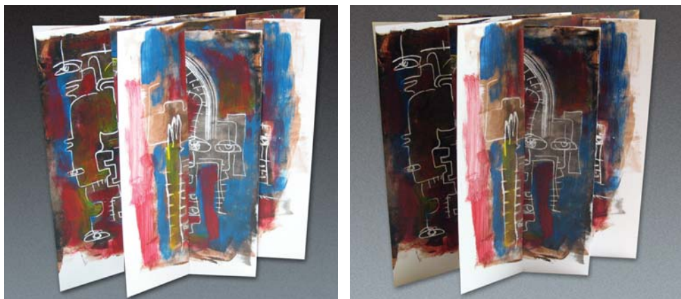
Mundos dislocados 1. Libro objeto colapsable Monotipo y acrílico sobre estireno

Las fronteras han desaparecido, el desconocimiento del "otro", el exotismo característico de los siglos XVIII y XIX, se desvanecen ante un sorprendente flujo de las imágenes. El planeta, en su totalidad, se ha encogido. Asistimos ahora a un falso pa-