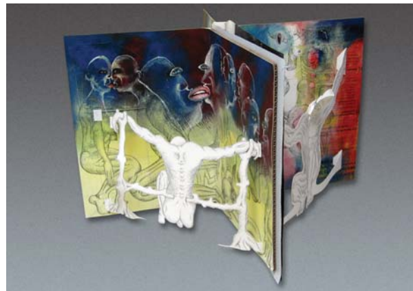
Bitácora de familia. Libro objeto colapsable

A manera de conclusión, deberé aclarar nuevamente que este es solamente un breve ensayo para resolver una propuesta gráfica y que, por supuesto, no soy un erudito en las materias antropológicas y aún sociológicas. Pero para mi resulta evidente que hemos perdido la capacidad de asombro de lo cotidiano. Que la tecnología avanza a pasos cada vez más agigantados, que, en efecto, se han roto los esquemas tradicionales de la comunicación humana. Que, como dice Bruno Munari (2002:17): "Lo que antes eran los únicos medios de comunicación visual, actualmente y en muchos casos, son inadecuados, estáticos, lentos." Que la realidad nos muestra a numerosas generaciones de estudiantes ávidos de conocer estas nuevas formas de comunicación. Pero que la irrupción de las nuevas tecnologías ha homogeneizado al diseño y a la comunicación visual. Y que su labor se ha perdido en los pasillos de los asombrosos programas de